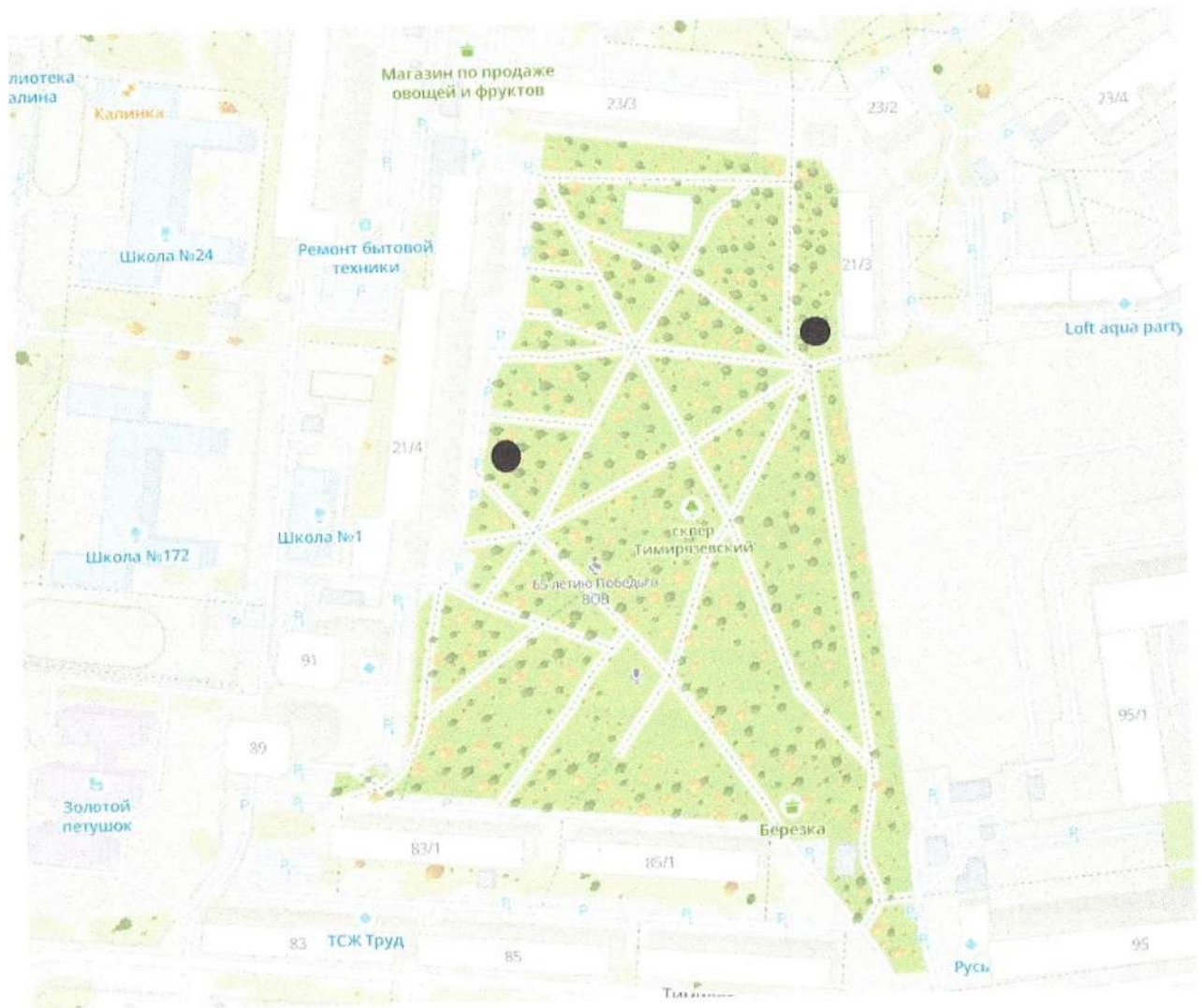
СХЕМА РАЗМЕЩЕНИЯ НЕСТАЦИОНАРНЫХ ОБЪЕКТОВ