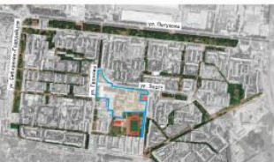
ЗАТУЛИНСКИЙ ДИСПЕРСНЫЙ ПАРК

Дисперсный парк – совокупность небольших общественных озелененных пространств, скверов, культурно-досуговых и спортивных объектов, созданных в границах жилых кварталов и расположенных в непосредственной близости от жилых застроек. В дисперсном парке не только озелененные зоны не только выполняют все функции обычного парка, но и распространяют мест активного и пассивного отдыха между территориями, позволяя предоставлять посетителям весь функциональный набор парка в радиусе пешеходной доступности.