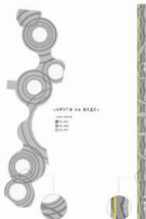
СХЕМА РАСКЛАДКИ ПЛИТКИ

Дисперсный парк – совокупность небольших общественных озелененных пространств, скверов, культурно-досуговых и спортивных объектов, созданных в границах жилых кварталов и расположенных в непосредственной близости от жилых застроек. В дисперсном парке не только озелененные зоны не только выполняют все функции обычного парка, но и распространяют мест активного и пассивного отдыха между территориями, позволяя предоставлять посетителям весь функциональный набор парка в радиусе пешеходной доступности.